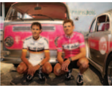
Angeschlagen: Keiner wird sich mehr um Jan Ullrich (mit Andreas Klöden) reißen.